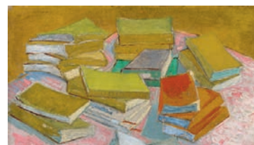
Vincent van Gogh, Piles de romans français , 1887 Huile sur toile, 54,4 x 73,6 cm Van Gogh Museum, Amsterdam (Vincent van Gogh Foundation)

Ce tableau témoigne de l'importance que revêtaient les livres et la lecture pour Vincent. Les ouvrages apparaissent ici tels des signes abstraits aux couleurs vives, flottant au-dessus d'une surface faite de traits roses, peints avec une grande liberté et une vivacité extraordinaire.