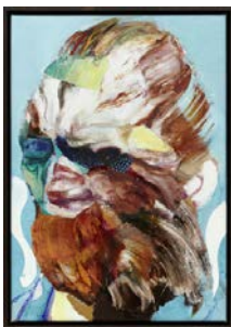
Adrian Ghenie, Lidless Eye , 2015 Huile sur toile, 43 x 30 cm © Adrian Ghenie