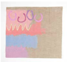
Campo rosa , 1984 Acrylique sur toile, 108 x 116 cm Avec l'aimable autorisation de l'artiste Crédit photographique : Giulio Caresio © Giorgio Griffa, Casey Kaplan New York