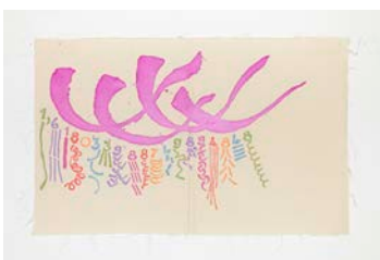
Canone aureo 848 , 2011 Acrylique sur toile, 57 x 91 cm Avec l'aimable autorisation de l'artiste Crédit photographique : Giulio Caresio © Giorgio Griffa, Casey Kaplan New York

Tous les visuels présents dans ce communiqué de presse sont téléchargeables en HD sur notre site Internet : www.fondation-vincentvangogh-arles.org