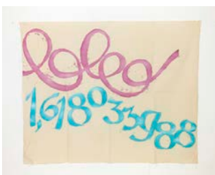
Canone aureo 988 , 2015 Acrylique sur toile, 140 x 172 cm Avec l'aimable autorisation de l'artiste Crédit photographique : Giulio Caresio © Giorgio Griffa, Casey Kaplan New York