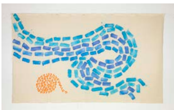
Canone aureo 705 (VVG) , 2015 Acrylique sur toile, 140 x 237 cm Avec l'aimable autorisation de l'artiste Crédit photographique : Giulio Caresio © l'artiste et Casey Kaplan