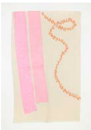
Canone aureo 628 , 2013 Acrylique sur toile, 160 x 100 cm Avec l'aimable autorisation de l'artiste Crédit photographique : Giulio Caresio © Giorgio Griffa, Casey Kaplan New York