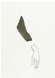
Silvia Bächli, Sans titre , 2013 Gouache sur papier, 62 x 44 cm © Silvia Bächli Avec l'aimable autorisation de l'artiste et de Peter Freeman Inc. New York