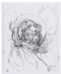
Glenn Brown, Drawing 13 (d'après Greuze/Rubens) , 2015 Encre de Chine sur papier, Pergamenata blanc, 50 x 40,8 cm Collection de l'artiste