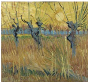
Vincent van Gogh, Saules têtards au soleil couchant , Arles, mars 1888 Huile sur toile sur carton, 31,6 x 34,3 cm Kröller-Müller Museum, Otterlo