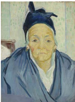
Vincent van Gogh, Vieille Arlésienne , Arles, février 1888 Huile sur toile, 58 x 42 cm Van Gogh Museum, Amsterdam (Vincent van Gogh Foundation)