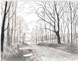
Woldgate, 16 & 26 mars de la série L'Arrivée du printemps en 2013 (deux mille treize)

Collection de la Fondation David Hockney