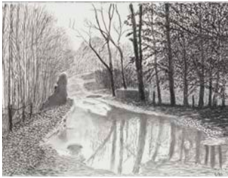
Woldgate, 6-7 février de la série L'Arrivée du printemps en 2013 (deux mille treize)