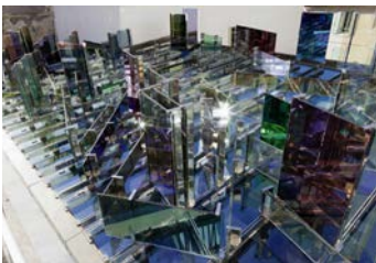
La Maison violette bleue verte jaune orange rouge , 2014 Installation permanente à Fondation Vincent van Gogh Arles 78 vitrages Luxar, acier inoxydable poli © Raphael Hefti, Fondation Vincent Van Gogh Arles Photographe : Gunnar Meier