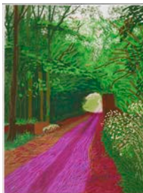
L'Arrivée du printemps à Woldgate, Est du Yorkshire en 2011 (deux mille onze) – 31 mai. N° 1

Collection de la Fondation David Hockney