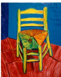
La Chaise et la pipe de Vincent, 1988