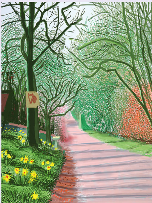
David Hockney, L'Arrivée du printemps à Woldgate, Est du Yorkshire en 2011 (deux mille onze) - 25 mars © David Hockney crédit photographique: Richard Schmidt