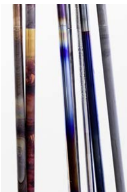
Various threaded poles of determinate length potentially altering their determinacy , 2015 Vue de l'installation, Centre d'Art Contemporain de Genève. Aluminium, cuivre, titane et différents types d'acier © Raphael Hefti, Nottingham Contemporary, Centre d'Art Contemporain de Genève, RaebervonStenglin, Zurich, Bruce Haines Mayfair, Londres Photographe : Gunnar Meier

Tous les visuels présents dans ce dossier de presse sont téléchargeables en HD sur notre site Internet : www.fondation-vincentvangogh-arles.org