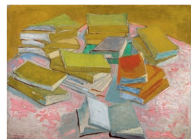
Vincent van Gogh, Piles de romans français , 1887 Huile sur toile, 54,4 x 73,6 cm Van Gogh Museum, Amsterdam (Vincent van Gogh Foundation)

Ce tableau témoigne de l'importance que revêtaient les livres et la lecture pour Vincent. Les ouvrages apparaissent ici tels des signes abstraits aux couleurs vives, flottant au-dessus d'une surface faite de traits roses, peints avec une grande liberté et une vivacité extraordinaire.