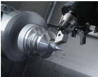
Documentation de la performance, Art Basel, Statements , 2015 © Raphael Hefti, RaebervonStenglin, Zurich Photographe : Stefan Altenburger