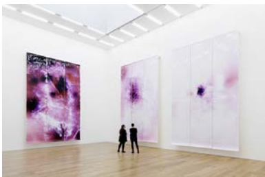
Tiré de la série Lycopodium , 2014, Vue de l'installation, Nottingham Contemporary. Photogrammes tirés sur des rouleaux entiers de papier couleur Fuji Crystal Archive grâce aux spores légèrement inflammables de la mousse Lycopodium, triptyque couleur © Raphael Hefti, Nottingham Contemporary, RaebervonStenglin, Zurich, Bruce Haines Mayfair, Londres Photographe : Gunnar Meier