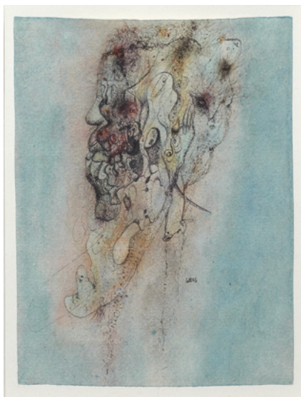
WOLS Tête , 1943 Aquarelle et gouache sur papier 16,5 × 12,5 cm