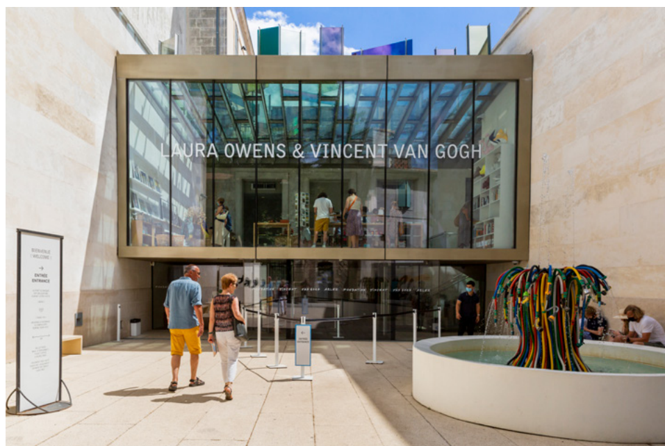
Entrée de la Fondation © Fondation Vincent van Gogh Arles © FLUOR architecture Photographie : Grégoire d'Albon

« Puis comme tu le sais bien, j'aime tant Arles [...]. » Lettre de Vincent à son frère Theo (Arles, 18 février 1889)