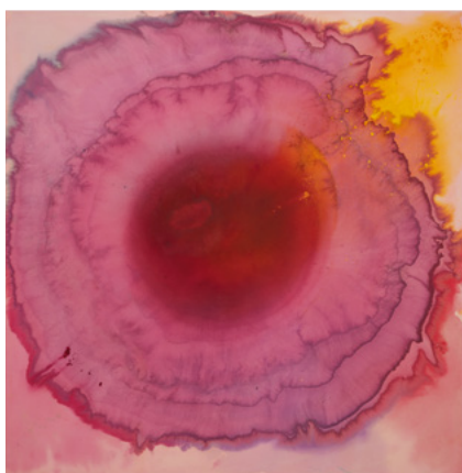
VIVIAN SPRINGFORD Untitled (Tanzania Series) [Sans titre (Séries Tanzanie)] , 1971 Acrylique sur toile, 176,5 × 173 × 3,5 cm Courtesy : Beth et Wyatt Crowell, la Vivian Springford Administration et Almine Rech © Vivian Springford Administration / Photographie : Matt Kroening