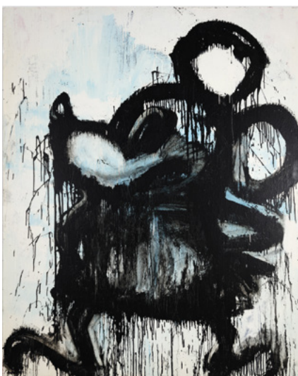
JOYCE PENSATO Blue Mickey [Mickey bleu] , 1998 Peinture émaillée sur toile 229 × 183 cm Collection privée