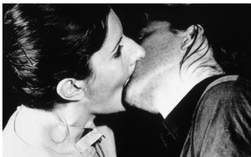
MARINA ABRAMOVIĆ & ULAY Breathing In/Breathing Out [Inspiration – Expiration] , 1977 Vidéo, 19 minutes