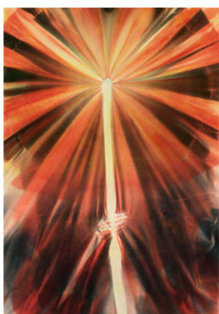
ANDRA URSUTA False Hope [Faux espoir] , 2020 Teinture photoréactive sur velours 114,9 × 96,8 cm