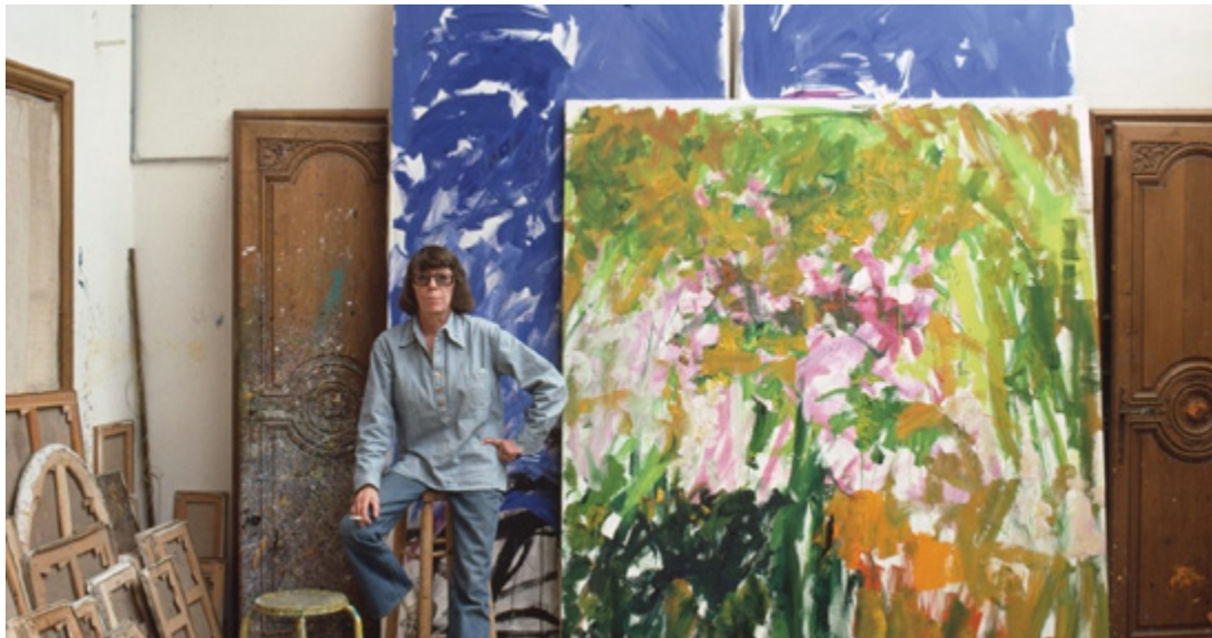
Joan Mitchell dans son studio à Vétheuil, 1983.

Première du genre en Europe, l'exposition célébrera une génération de femmes artistes, connues et moins connues, travaillant dans la veine du mouvement de l'expressionnisme abstrait.