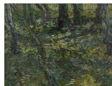
Vincent van Gogh, Sous-bois , juillet 1889 Huile sur toile, 49 x 64,3 cm Van Gogh Museum, Amsterdam (Vincent van Gogh Foundation)

Peint lors de son séjour à Saint-Rémy-de-Provence, Sous-bois est l'une des deux variations du motif forestier provençal de Vincent van Gogh. Ce coin de forêt aux tonalités sombres est parsemé de touches vivaces qui viennent éclaircir par endroits le feuillage mouvementé.