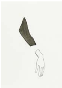
Silvia Bächli, Sans titre , 2013 Gouache sur papier, 62 x 44 cm © Silvia Bächli Avec l'aimable autorisation de l'artiste et de Peter Freeman Inc. New York