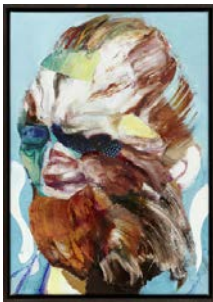
Adrian Ghenie, Lidless Eye , 2015 Huile sur toile, 43 x 30 cm © Adrian Ghenie