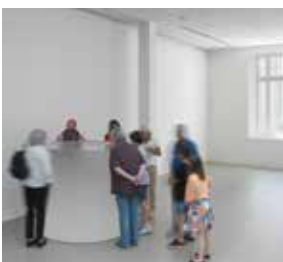
Roni Horn, Untitled ("Two thick ropes of dark blood and two slender rose like snakes from the stump of his neck and arched hissing into the fire. The head rolled to the left and came to rest... The fire streamed and blackened and a gray cloud of smoke rose and the columnar arches of blood slowly subsided until just the neck bubbled gently like stew"), 2015 Bloc de verre moulé aux surfaces brutes. 128,9 x 142,2 cm