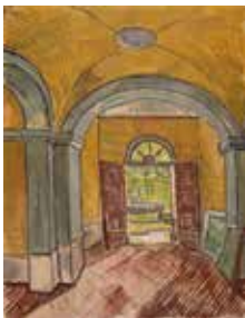
Vincent van Gogh, Vestibule de l'asile , 1889 Craie noire, peinture à l'huile au pinceau, sur papier vergé rose 61,6 x 47,1 cm Van Gogh Museum, Amsterdam (Vincent van Gogh Foundation)