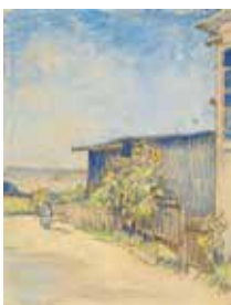
Vincent van Gogh, Petite grange avec tournesols , 1887 Mine de plomb, encre brune à la plume, peinture à l'eau transparente et couvrante, sur papier vélin 31,6 x 24,1 cm Van Gogh Museum, Amsterdam (Vincent van Gogh Foundation)