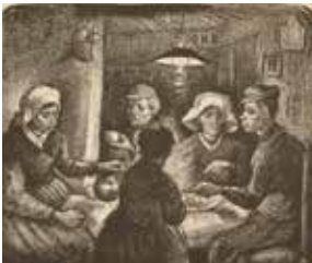
Vincent van Gogh, Les Mangeurs de pommes de terre , 1885 Lithographie 26,5 x 32 cm Van Gogh Museum, Amsterdam (Vincent van Gogh Foundation)