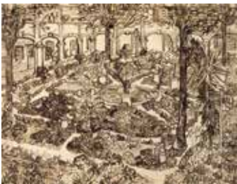
Vincent van Gogh, Le Jardin de l'hôpital , 1889 Mine de plomb, encre brune et noire à la plume de roseau, à la plume et au pinceau, sur papier vergé 46,6 x 59,9 cm Van Gogh Museum, Amsterdam (Vincent van Gogh Foundation)