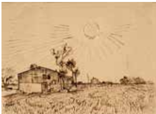
Vincent van Gogh, Champ avec maisons , 1888 Mine de plomb, encre brune à la plume et à la plume de roseau, sur papier vélin 25,8 x 34,9 cm Van Gogh Museum, Amsterdam (Vincent van Gogh Foundation)