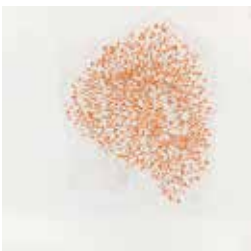
Roni Horn, If 2 , 2011 Pigment en poudre, graphite, fusain, crayon de couleur et vernis sur papier 250,8 x 257,8 cm