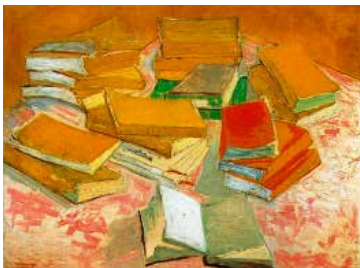
Vincent van Gogh, Piles de romans français , 1887 Huile sur toile, 54,4 x 73,6 cm Van Gogh Museum, Amsterdam (Vincent van Gogh Foundation)

Depuis son ouverture, la Fondation bénéficie d'un prêt annuel du Musée Van Gogh d'Amsterdam, initié entre avril 2014 et mars 2015 avec le tableau Autoportrait à la pipe et au chapeau de paille . Depuis le 1 er avril 2015, ce premier prêt a été renouvelé avec la présentation de Piles de romans français , une œuvre peu connue peinte à Paris en 1887. Cette composition aux traits esquissés, empreinte d'un caractère libre, fait apparaître l'influence du « style japonais » que Vincent développera plus tard à Arles.