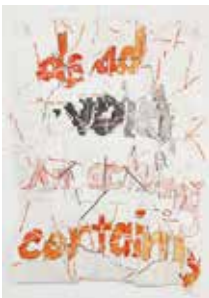
Roni Horn, Hack Wit-dead void , 2014 Aquarelle, encre à la plume, gomme arabique sur papier aquarelle, ruban adhésif 58,4 x 41,9 cm Photographe : Genevieve Hanson Avec l'aimable autorisation de l'artiste et Hauser & Wirth