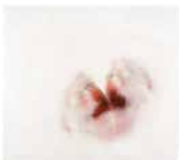
Roni Horn, Clownpout (4) , 2003 Deux photographies couleur découpées et recomposées 103,5 x 114,9 cm