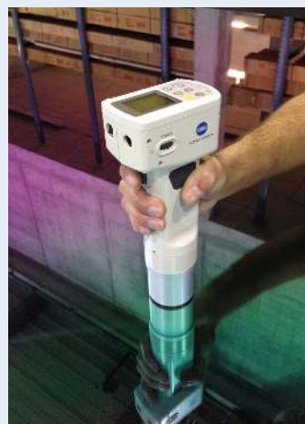
Raphael Hefti, documentation de la production de La Maison violette bleue verte jaune orange rouge , 2014.

35 TER RUE DU DOCTEUR FANTON, 13200 ARLES