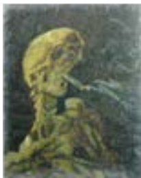
Parker Ito Asian Goddess Smoking Fetish 4 (Fétiche de la déesse asiatique fumant 4), 2022 Encre et huile sur toile, 50 x 63 cm