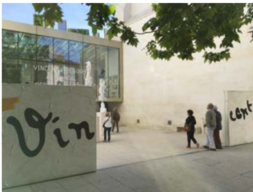
Entrée de la Fondation, portail Vincent (2014) de Bertrand Lavier © Fondation Vincent van Gogh Arles / FLUOR architecture Photo : Flavia Vogel

« Puis comme tu le sais bien j'aime tant Arles [...]. » Lettre de Vincent à son frère Theo (Arles, 18 février 1889)