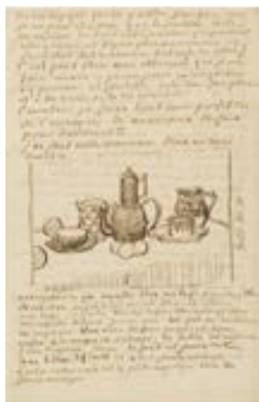
VINCENT VAN GOGH, LETTRE À THEO Arles, le ou vers le dimanche, 20 mai 1888 Fac-similé de la page 4 1 Van Gogh Museum, Amsterdam (Vincent van Gogh Foundation)

C'est depuis « la grande route dans les blés 2 » que Vincent van Gogh peint Champ de blé avec coquelicots . Au cours du printemps 1888, il arpente régulièrement l'avenue de Montmajour car elle lui permet d'accéder rapidement à la campagne et à la nature depuis la maison jaune. La composition du tableau s'organise autour d'une ligne d'horizon lointaine sur laquelle on distingue un corps de ferme. Mais Van Gogh, comme souvent, s'intéresse plutôt au ciel épais et dynamique, qu'il représente au-dessus d'un champ verdoyant d'où émergent, grâce à une touche sautillante, les tâches rouges des coquelicots.