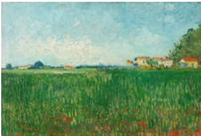
VINCENT VAN GOGH CHAMP DE BLÉ AVEC COQUELICOTS, ARLES, MAI 1888 Huile sur toile, 24 × 35 cm Van Gogh Museum, Amsterdam (Vincent van Gogh Foundation)