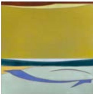
Julie Beaufls Le Parc , 2023 Huile sur toile, 130 x 130 cm Collection privée