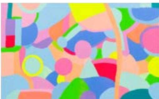
Adee Roberson Transition South (Transition vers le sud), 2022 Acrylique et pastel sur lin, 254 x 154 cm