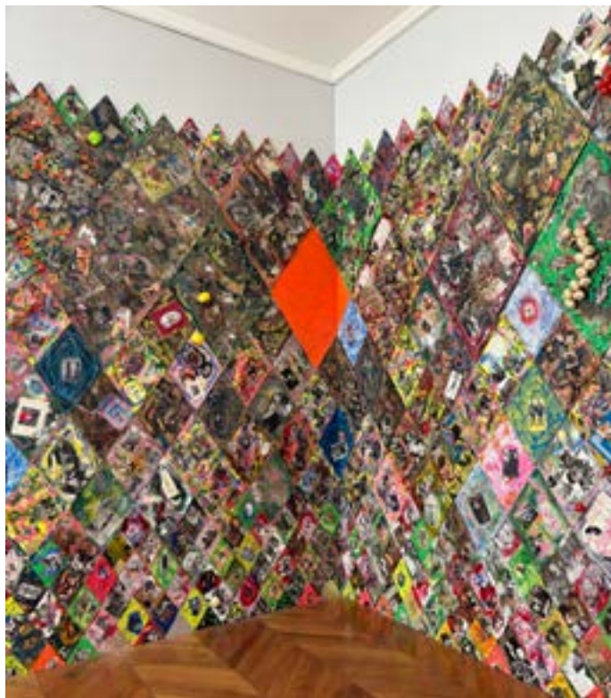
Clément Courgeon dit Triboulet (* 1997), Harlequin is a wrestler [Arlequin est un lutteur], 2026 Collage, vernis, fil, encre, perles, métal, plastique, cheveux, poils, confettis et sang de porc sur carton, dimensions variables Courtesy : Clément Courgeon dit Triboulet

À la façon de Triboulet, réalise ton panneau artistique et invente ta propre star !