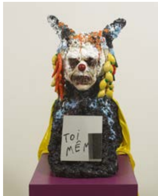
Arnaud Labelle-Rojoux (* 1950), Toi-même ! , 2011

Figure singulière de la scène artistique française à la fois artiste, écrivain, enseignant et performeur, Arnaud Labelle-Rojoux développe depuis les années 1980 une œuvre plastique, théorique et performative, traversée par l'humour, la culture populaire et l'histoire de l'art, portant une attention constante aux formes marginales ou non académiques.