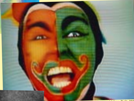
© Bruce Nauman / Adagp, Paris, 2026