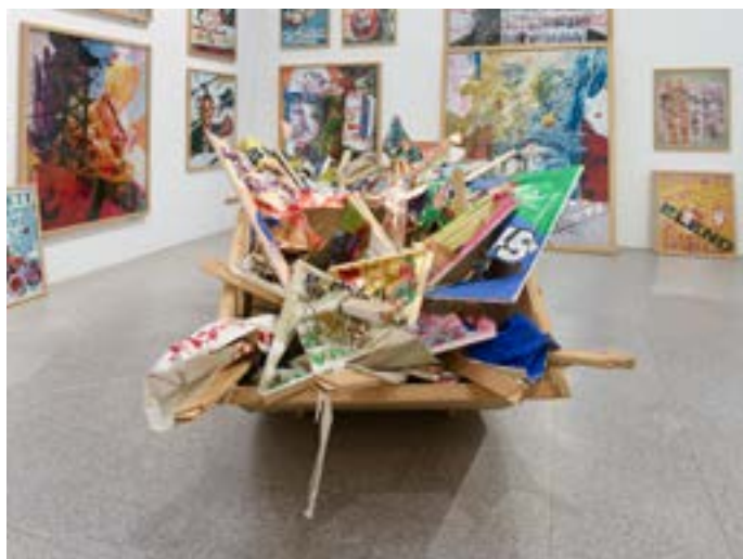
Martin Kippenberger (1953-1997), Heavy Burschi (« Heavy Lad ») [Gros gars], 1989-1990 Benne, peintures détruites et 33 photographies couleur encadrées, dimensions variables Defares Collection

À toi de tenter l'expérience de déchirer et déconstruire pour mieux créer !