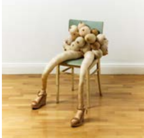
Sarah Lucas (* 1962), Titti Doris , 2017 Collants, rembourrage, chaise et chaussures, 82 x 90 x 90 cm

Jouant du grotesque, du détournement et de la littéralité, elle transforme des objets ordinaires en figures ambiguës, à la fois comiques et dérangeantes. Entre dérision et malaise, ses œuvres mettent en crise les représentations traditionnelles de la féminité et les rapports de pouvoir qui les traversent.