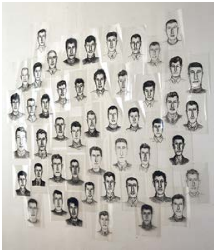
Maurizio Cattelan (* 1960), Super Us [Super nous], 1992

Viens mener l'enquête et réaliser le portrait du suspect recherché en t'inspirant de l'œuvre Super Us (1992) de Maurizio Cattelan.