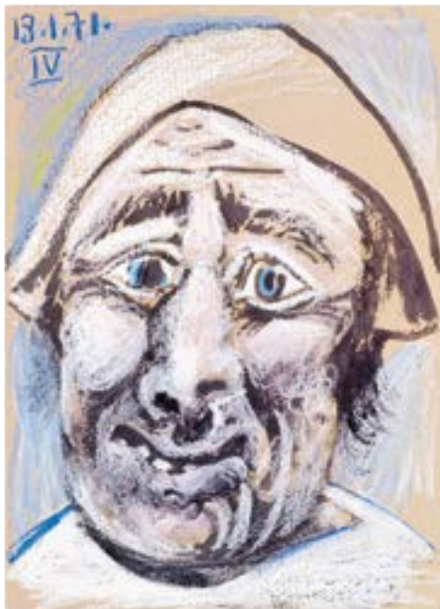
Pablo Picasso (1881-1973), Tête d'Arlequin, 13 janvier 1971 Encre de Chine et craie de couleur sur carton, 31,1 x 22,5 cm Don de l'artiste en 1971 Collection Musée Réattu, Arles

Avant et après lui, les artistes ne cessent de se mettre en scène – parfois enlaidis, embellis ou grimés. Ensemble nous essaierons de comprendre ce qui les pousse à autant se représenter.