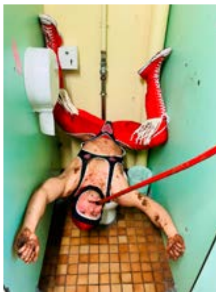
Clément Courgeon dit Triboulet (* 1997), Triboulet Catch the Broom [Triboulet catch le balai], 2026 Vidéo couleur et son, 8 min 13 s Co-réalisation : Pablo Dury

Dans ses films et performances, Clément Courgeon s'emploie à endosser le rôle de différentes figures emblématiques de la culture populaire ; il mixe et syncrétise images, actions et références afin d'interroger les mécanismes et stéréotypes qui régissent nos sociétés.