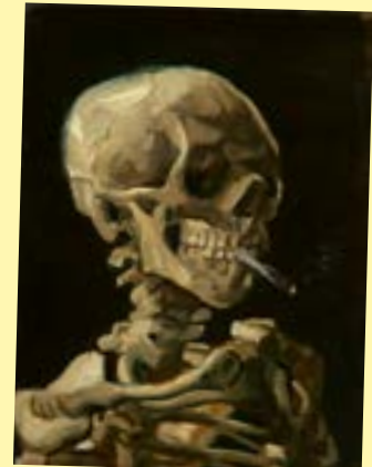
Vincent van Gogh (1853-1890), Crâne de squelette fumant une cigarette , Anvers, janvier-février 1886 Huile sur toile, 32,3 x 24,8 cm Van Gogh Museum, Amsterdam (Vincent van Gogh Foundation)