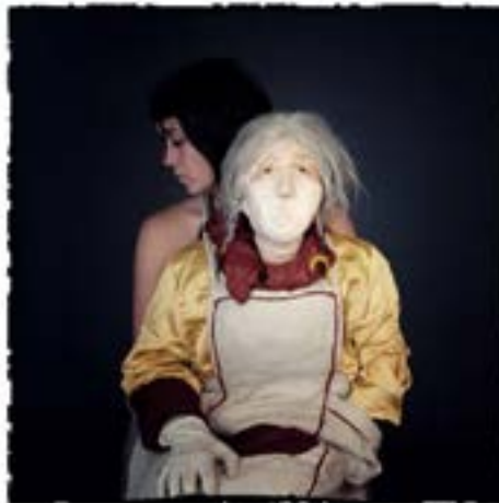
Photographie d'une marionnette de Séverine Thevenet.

Entre argentique et spectacle vivant, l'art singulier que pratique Séverine Thevenet permet à de multiples facettes de se rencontrer pour rendre visible l'invisible.